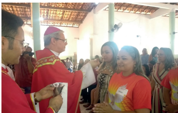
Crisma em Cristino Castro-PI