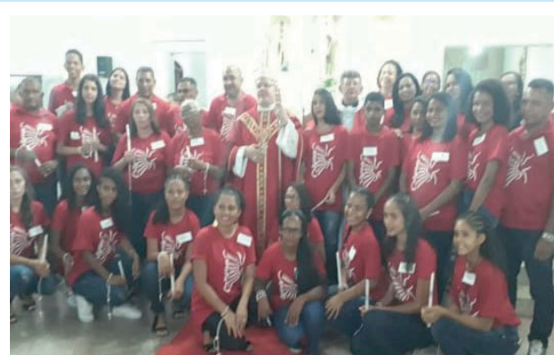
Crisma em Barreiras-PI