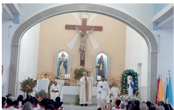
Festa da Imaculada em Corrente-PI.